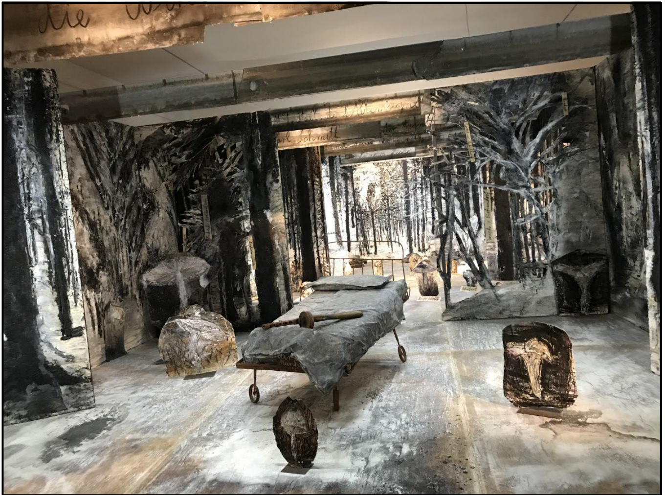
FIGUUR 5a: Anselm Kiefer, Winterreise ('Winter Journey') , installasie, emulsie, olie, akriel, skellak, houtskool op doek en hout met loodvoorwerpe, metaal, hars, hout, verbrande boeke en karton, 2015–2020.