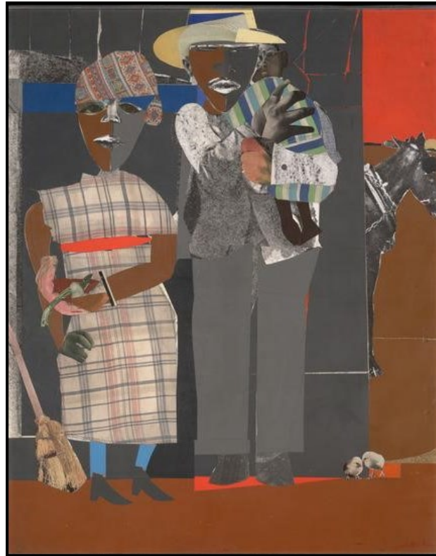
FIGUUR 6a: Romare Bearden, Continuities (Aaneenlopendheid) , collage op bord, 1969.

Aaneenlopendheid ('Continuities'): Ononderbroke of konsekwente bestaan met verloop van tyd