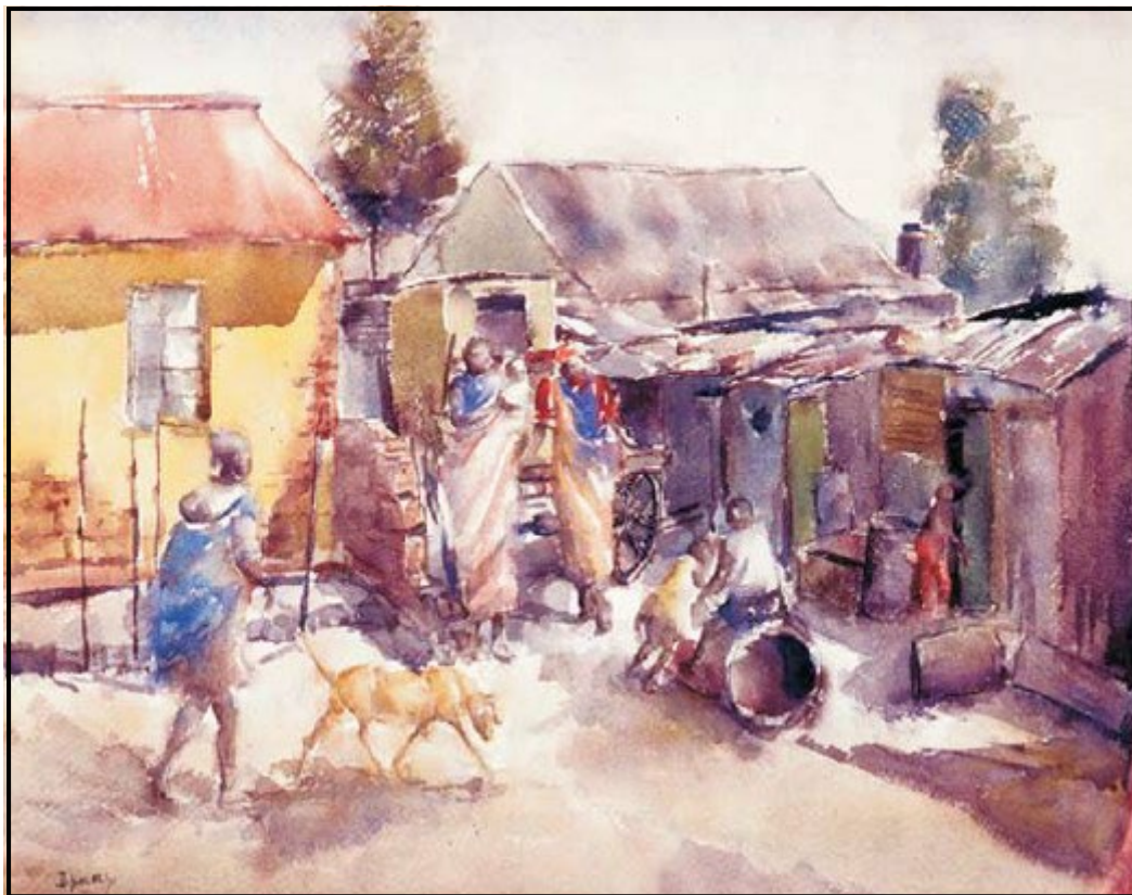
FIGUUR 1a: Durant Sihlali, Primville location (Primville-lokasie) , waterverfskildery, 1971.