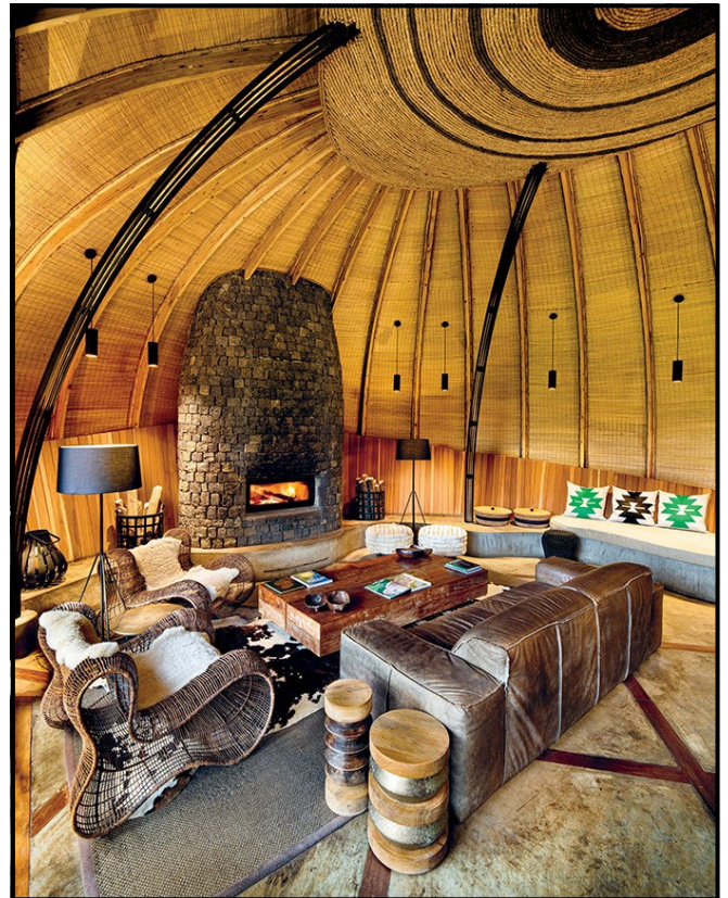
FIGUUR 8a en 8b: Nick Plewman Argitekte, Rwanda Lodge, Rwanda Wilderness (Wildernis) Bisate (Africa), foto's deur Crookes en Jackson geneem, 2018.