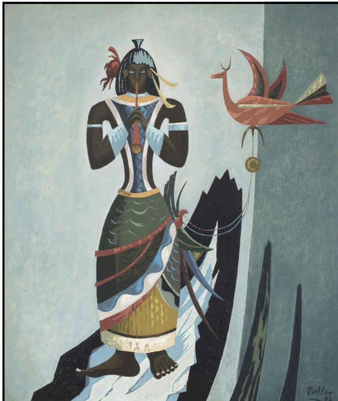
FIGUUR 2a: Alexis Preller, Herdboy (Veewagter) (Seun met Fluit) , olieverf op doek, 1962.