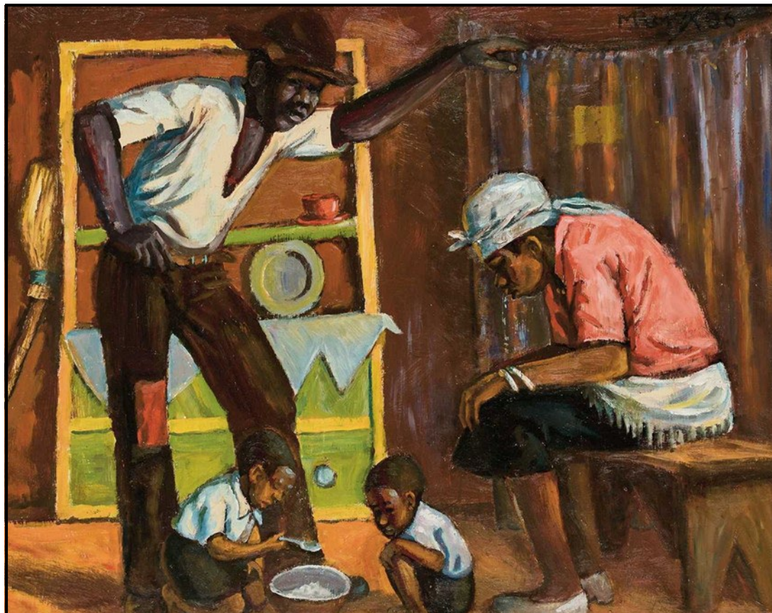
FIGUUR 1b: George Pemba, Unemployed (Werkloos) , olieverf op bord, 1986.