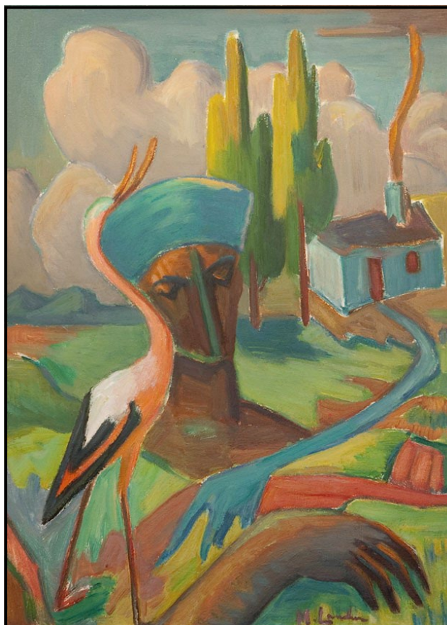
FIGUUR 2b: Maggie Laubser, Bird, head and house in a landscape (Voël, kop en huis in 'n landskap) , olieverf op bord, 1957.