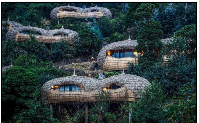
FIGUUR 8c en 8d: Nick Plewman Argitekte, Rwanda Lodge, Rwanda Wilderness (Wildernis) Bisate , ses ruim, voëlmesagtige villas rus op ruie plantegroei, datum onbekend.

Bisate: Dit beteken 'stukke' in Kinyarwanda, wat na 'n vulkaan se natuurlike erosie verwys.