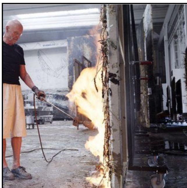
FIGUUR 5b: Anselm Kiefer besig om in sy ateljee te werk.